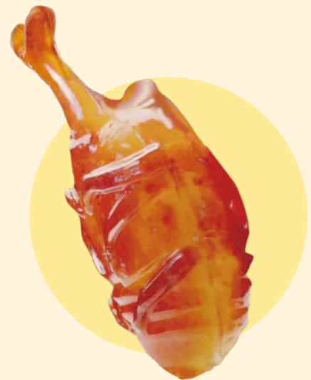
▲ 出来上がりイメージ